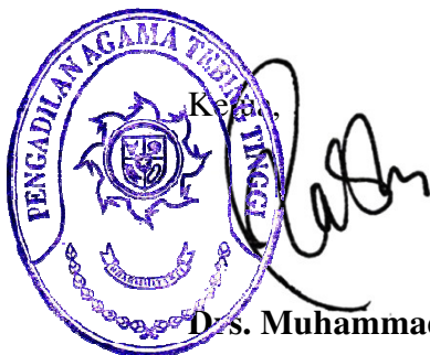
Drs. Muhammad Kasim, M.H.

Pihak kedua akan melakukan supervisi yang diperlukan serta akan melakukan evaluasi terhadap capaian kinerja dan perjanjian ini dan mengambil tindakan yang diperlukan dalam rangka pemberian penghargaan dan sanksi.